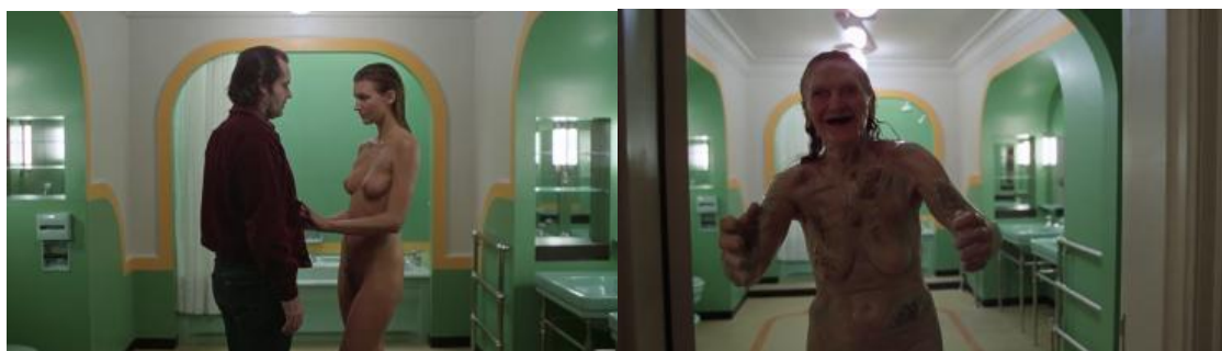
Figura 5. Mulher do quarto 237

Fonte: O Iluminado , de Stanley Kubrick, 1980.