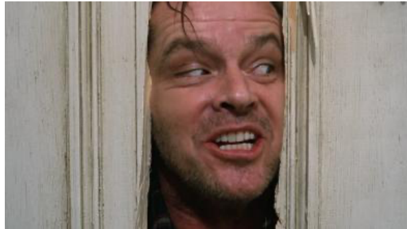
Figura 6. Jack Nicholson em cena icônica

Fonte: O Iluminado , de Stanley Kubrick, 1980.