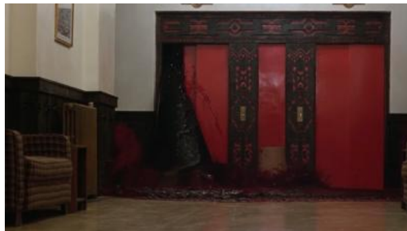
Figura 3. Elevador transbordando sangue

Fonte: O Iluminado , de Stanley Kubrick, 1980.