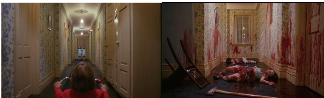
Figura 2. Danny se encontra com as meninas fantasmas

Fonte: O Iluminado , de Stanley Kubrick, 1980.