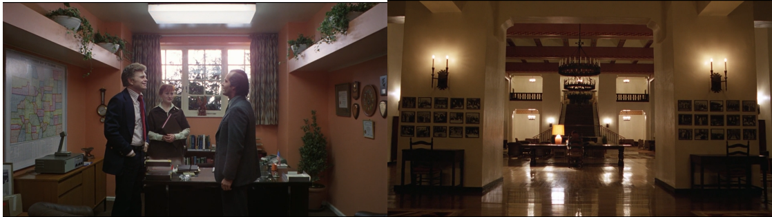
Figura 1. Os espaços do Overlook e a pequenez de Jack

Fonte: O Iluminado , de Stanley Kubrick, 1980.