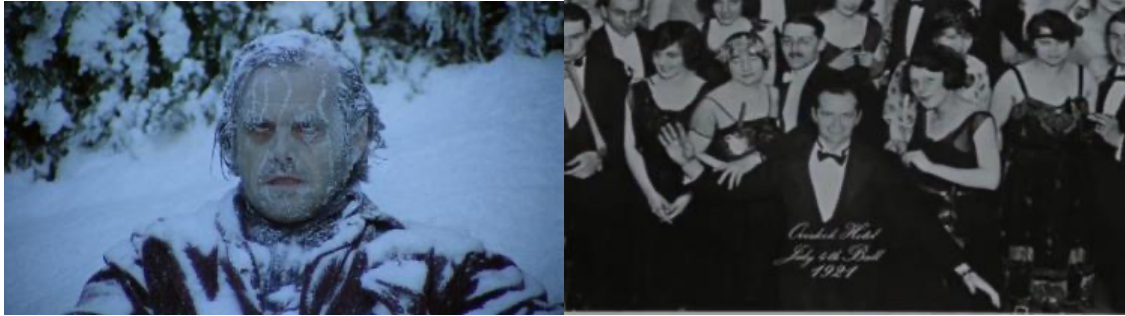
Fonte: O Iluminado , de Stanley Kubrick, 1980.