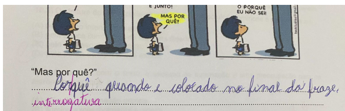
Figura 1: Prova de linguagem realizada por Pedro

Durante a análise das provas de Pedro foi possível observar com mais clareza o que as professoras apontam como sintomas indicativos das dificuldades apresentadas pelo aluno durante a aprendizagem da leitura e escrita, que é a troca de fonemas e sílabas, o que reflete na maneira como a criança vai escrever determinadas palavras.