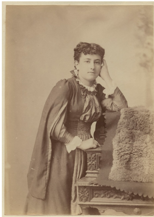
Figura 1. Olive Schreiner nos anos 1880, autoria desconhecida

pública como progressista e dissidente (First; Scott, 1990, p. 151). Isso é visível, a título de exemplo, em sua aderência ao movimento dress reform , que almejava mudar os paradigmas do vestuário feminino em favor do conforto e praticidade para a nova geração de mulheres que se inseriam na força de trabalho urbano, nos esportes e nos espaços públicos (Aslin, 1969, p. 147). Nos retratos fotográficos, Schreiner (Fig. 1) se mostra uma mulher inclinada à silhueta natural e à parcimônia nos adornos, a ponto de seu desdém pela moda rígida e burlesca da época lhe causar infâmia ao ser confundida com uma desvalida em um hotel e uma prostituta numa estação de trem (Jay, 2003, p. XXVI).