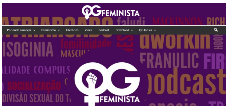
Fig. 2: Captura de tela da página do site QG Feminista