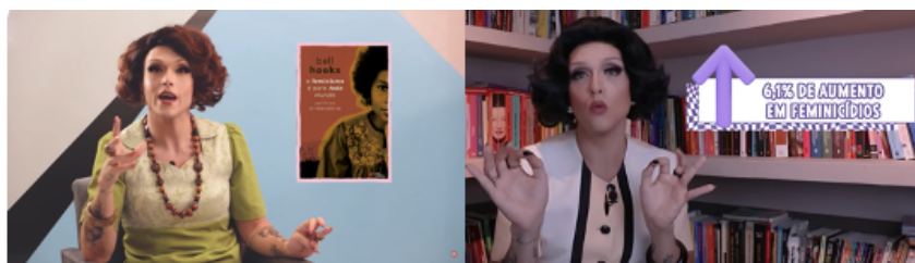
Fig. 8: Capturas de tela dos vídeos “EU NÃO SOU UMA MULHER” (Von Hunty, 2020) e “VIOLÊNCIA DE GÊNERO (Von Hunty, 2023)”.

Rita, por sua vez, por produzir textos orais, não precisa lançar mão de recursos textuais como negrito ou tamanho de fonte para dar destaque a alguns trechos de sua fala, ela o faz oralmente, aumentando o tom de voz, ou fazendo a silabificação de palavras. Mesmo assim, podemos observar recursos em comum entre Rita e Furiosa, como o uso de imagens representativas; e o destaque a certas palavras, citações, expressões ou enunciados ditos no vídeo inserindo-os por escrito na tela, como observamos na Figura 8.