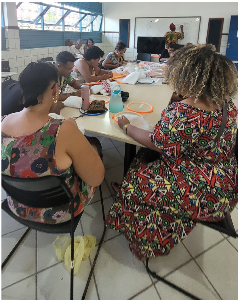
FIGURA 4 –REGISTRO DE INTERAÇÃO ENTRE PARTICIPANTES E MINISTRANTE DURANTE A ATIVIDADE DA OFICINA/ FONTE: REGISTRO DE LEILA CARVALHO (2024).

Como dito na seção anterior, a oficina reuniu participantes de diferentes gerações. Essa diversidade etária enriqueceu os encontros, ainda que as formas de participação variassem. A mais jovem do grupo, com 17 anos, mantinha-se mais reservada: observava com atenção, participava com gestos sutis, sorria diante das falas mais engraçadas e, ocasionalmente, se aproximava de outras participantes para se entrosar. As demais mantinham um convívio marcado por espontaneidade, conversas animadas, risadas constantes e até momentos de canto coletivo. Havia uma dinâmica de agrupamento e dispersão: em certos momentos, pequenas rodas de conversa se formavam, mas logo se dissolviam, retornando à convivência coletiva.