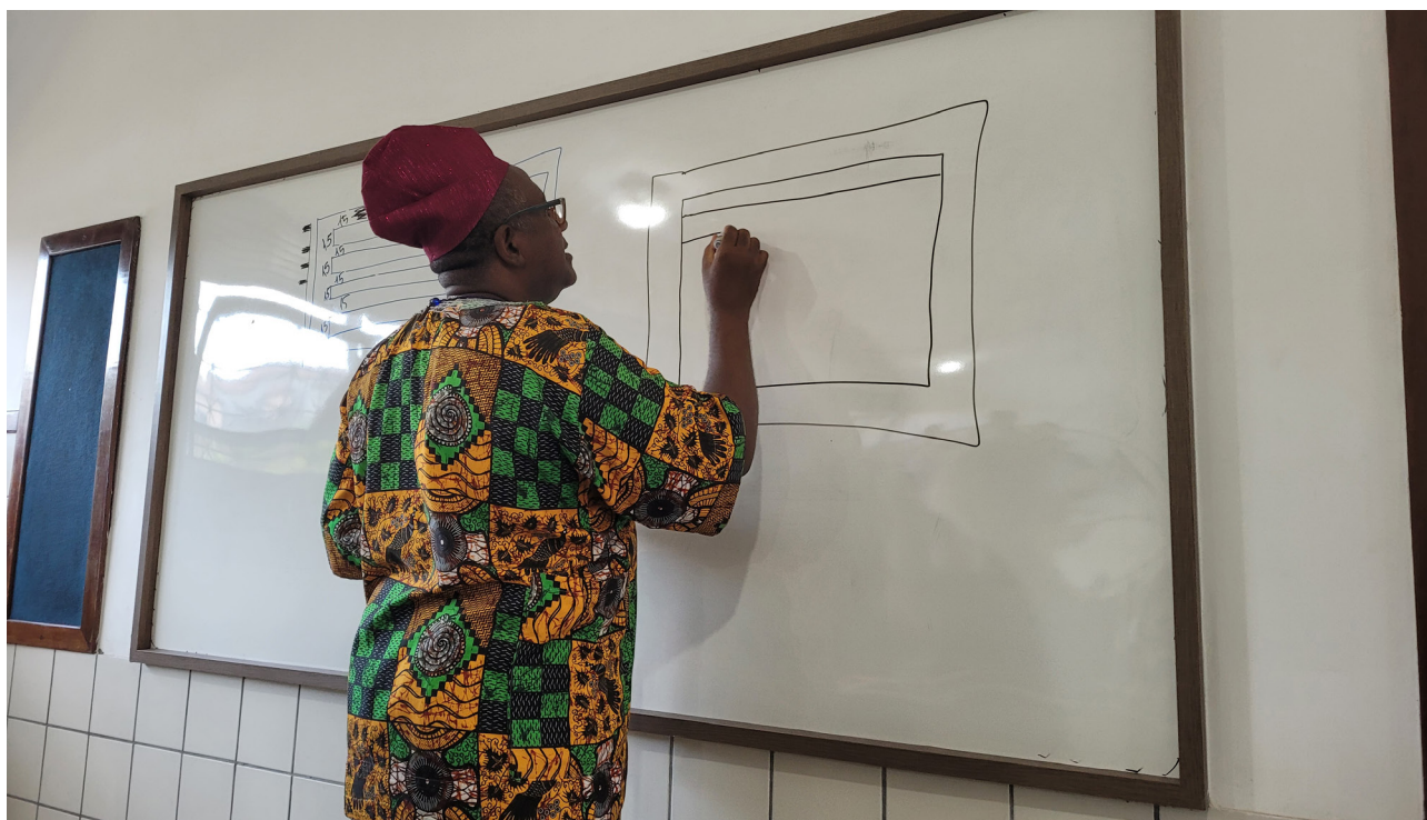
FIGURA 2 – MOMENTO DE APRENDIZAGEM COM O MINISTRANTE DURANTE A OFICINA