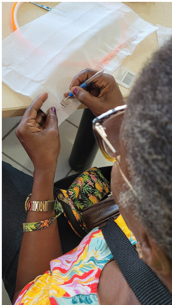
FIGURA 1 – PROCESSO DE DESFIAMENTO