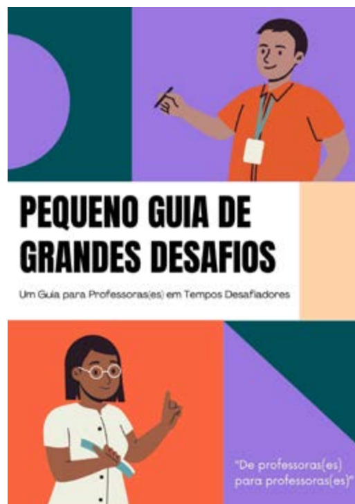
FIGURA 1 – CAPA DO LIVRETO “PEQUENO GUIA DE GRANDES DESAFIOS”/ FONTE: AUTORIA PRÓPRIA (2025).

Como um dos frutos mais concretos da proposta, foi produzido coletivamente no último encontro dialógico o livreto “Pequeno guia de grandes desafios” (Figura 1), material educativo que reúne alternativas construídas pelos próprios professores para lidar com as três temáticas centrais identificadas na intervenção: capacitismo, violência e uso excessivo de telas. A elaboração conjunta do guia fortaleceu o sentimento de pertencimento dos participantes e resultou em um instrumento de apoio ao enfrentamento desses desafios no cotidiano escolar.