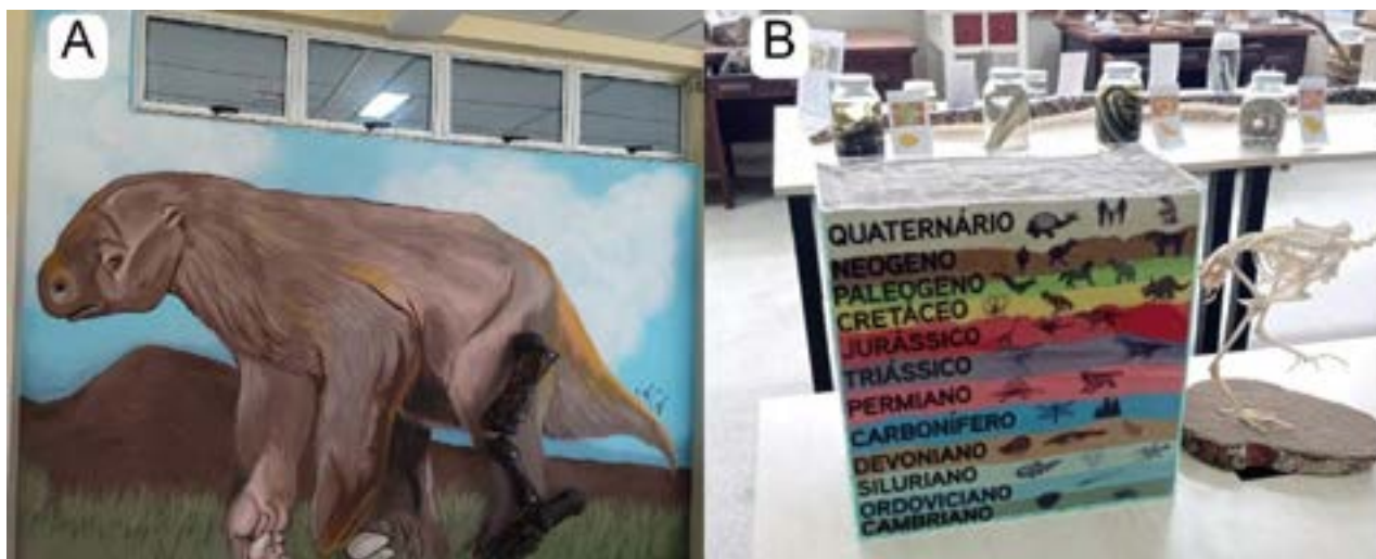
FIGURA 5- MATERIAIS DESENVOLVIDOS PARA EXPOSIÇÃO NO MUSEU DE ZOOLOGIA PALEONTOLOGIA DA UFRB (MURB). A, PAINEL DA PREGUIÇA GIGANTE ASSOCIADO À ESCULTURA DO MEMBRO POSTERIOR; B, TABELA DO TEMPO GEOLÓGICO.

As visitas à exposição do MURB já foram abertas ao público escolar, desde setembro de 2024, e através delas foi possível perceber o interesse e admiração pelo painel confeccionado, já que, para a maioria do público, o contato com os fósseis e com uma reconstituição dos animais extintos aconteceu pela primeira vez.