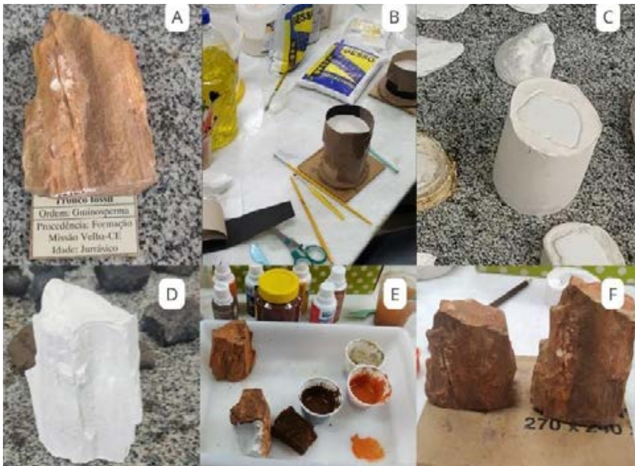
FIGURA 1– A, TRONCO FÓSSIL ESCOLHIDO PARA COMPOR O KIT DIDÁTICO; B, NA CONFECÇÃO DO MOLDE O FÓSSIL FOI PROTEGIDO COM DETERGENTE, POSICIONADO EM UMA BASE DE MASSA DE MODELAR, AO SEU REDOR FOI ERGUIDA UMA PAREDE DE PAPEL CARTÃO E EM SEGUIDA DESPEJADO SILICONE NO INTERIOR; C, COM O MOLDE PRONTO, O INTERIOR FOI PREENCHIDO COM GESSO; D, RÉPLICA DE GESSO SECA E LIXADA; E, PROCESSO DE PINTURA; F, RÉPLICA FINALIZADA À ESQUERDA DA IMAGEM E TRONCO FÓSSIL À DIREITA.

O processo de confecção das réplicas seguiu, respectivamente, os seguintes passos, como ilustra a Figura 1, preparação do fóssil (A), criação do molde a partir do fóssil (B), preenchimento do molde (C), acabamento (D, E), réplica finalizada ao lado do fóssil original (F).