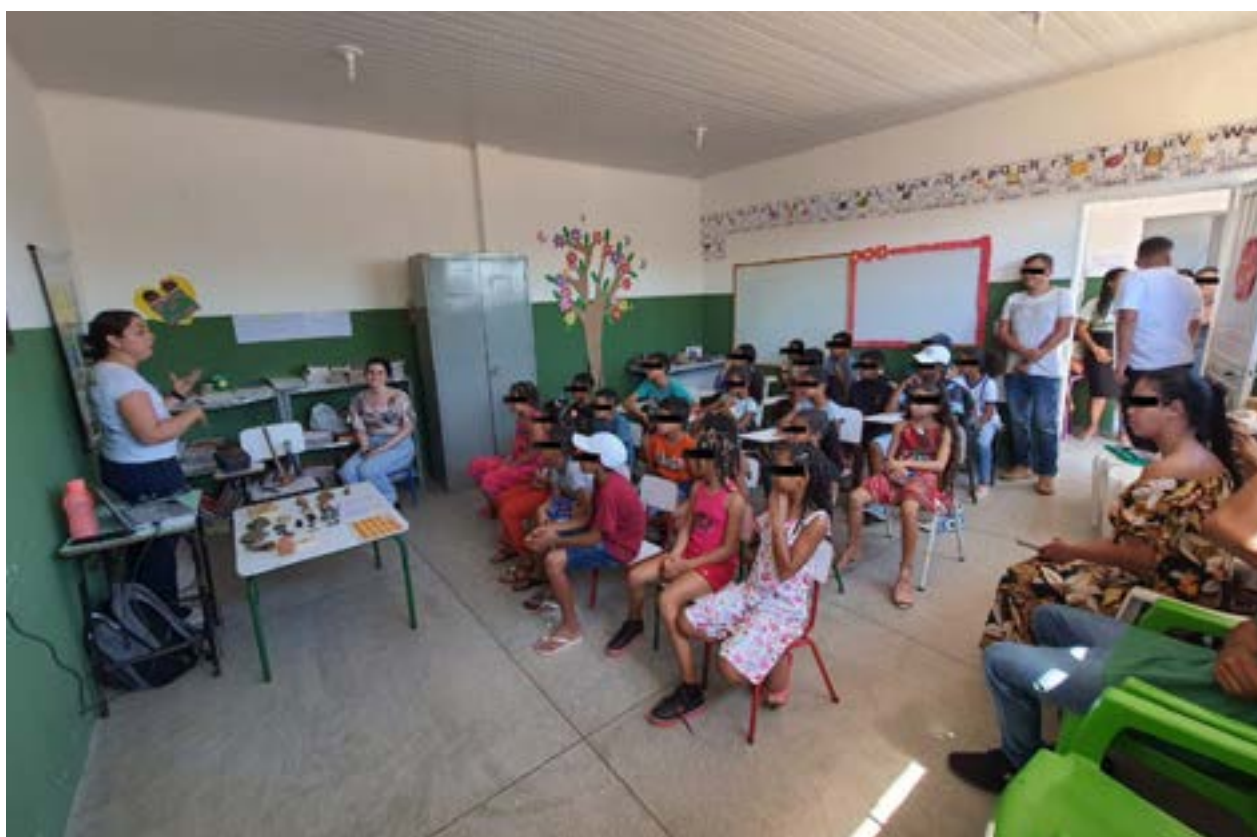
FIGURA 4—EXPOSIÇÃO DE PALEONTOLOGIA EM NO COLÉGIO JOÃO PAULO II

Dentre as escolas participantes, destaca-se aqui a aplicação do kit didático realizada no município de Santaluz, BA, local onde há um grande registro fóssil de animais da megafauna, sendo um importante palco de estudo e coletas. O evento ocorreu na escola municipal no povoado de Lajedinho (zona rural da cidade de Santaluz), e contou com a participação dos alunos do ensino fundamental da escola sede do evento, como também de escolas vizinhas, além dos moradores da região. O material informativo foi distribuído de forma mista com o uso banners, exposição dos fósseis encontrados na região em coletas anteriores, exposição das réplicas do kit didático. E para conceituar todo o material foi realizada uma palestra com as principais linhas de estudo da paleontologia (Figura 4), o que faz o paleontólogo, como cuidar do patrimônio fóssil, seguida pela apresentação do material em exposição.