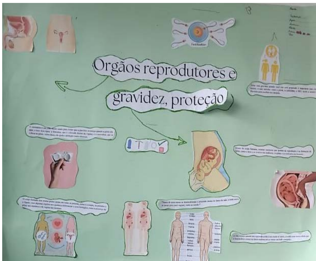
FIGURA 3 – MATERIAL EDUCATIVO SOBRE ÓRGÃOS REPRODUTORES, GRAVIDEZ E PROTEÇÃO