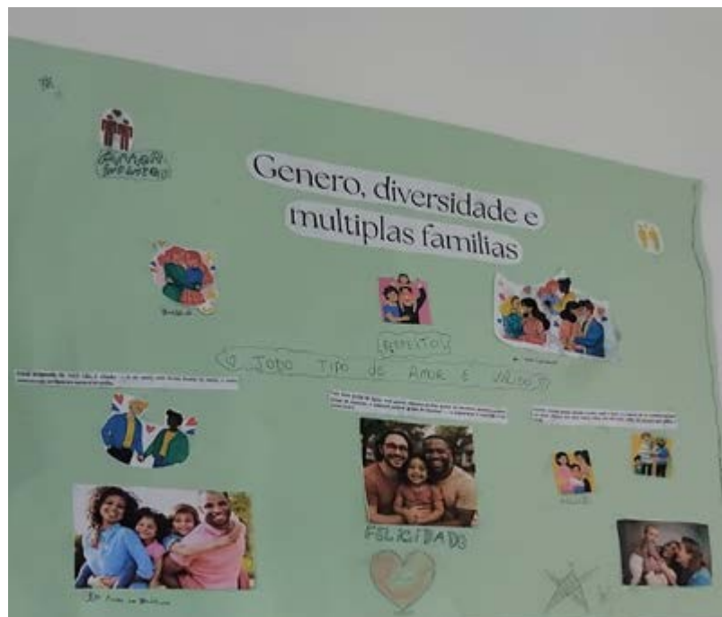
FIGURA 2 – MATERIAL EDUCATIVO SOBRE GÊNERO, DIVERSIDADE E MÚLTIPLAS FAMÍLIAS / FONTE: ELABORAÇÃO PRÓPRIA (2025).