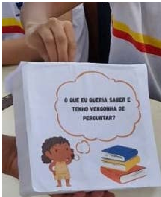
FIGURA 1- CAIXA ANÔNIMA "O QUE EU QUERIA SABER E TENHO VERGONHA DE PERGUNTAR?"/ FONTE: ELABORAÇÃO PRÓPRIA (2025).

Dessa forma, foi perceptível que a referida oficina se mostrou particularmente significativa no que diz respeito ao reconhecimento vocabular e às experiências culturais que compõem o cotidiano das crianças. A partir de uma escuta atenta e situada, foi possível acessar os conhecimentos prévios que elas já possuíam sobre o tema proposto, revelando percepções moldadas por suas trajetórias, contextos familiares e socioculturais. Tal perspectiva dialoga com a concepção de educação problematizadora defendida por (Freire, 1987), ao reconhecer os saberes construídos na vivência como ponto de partida para a aprendizagem significativa.