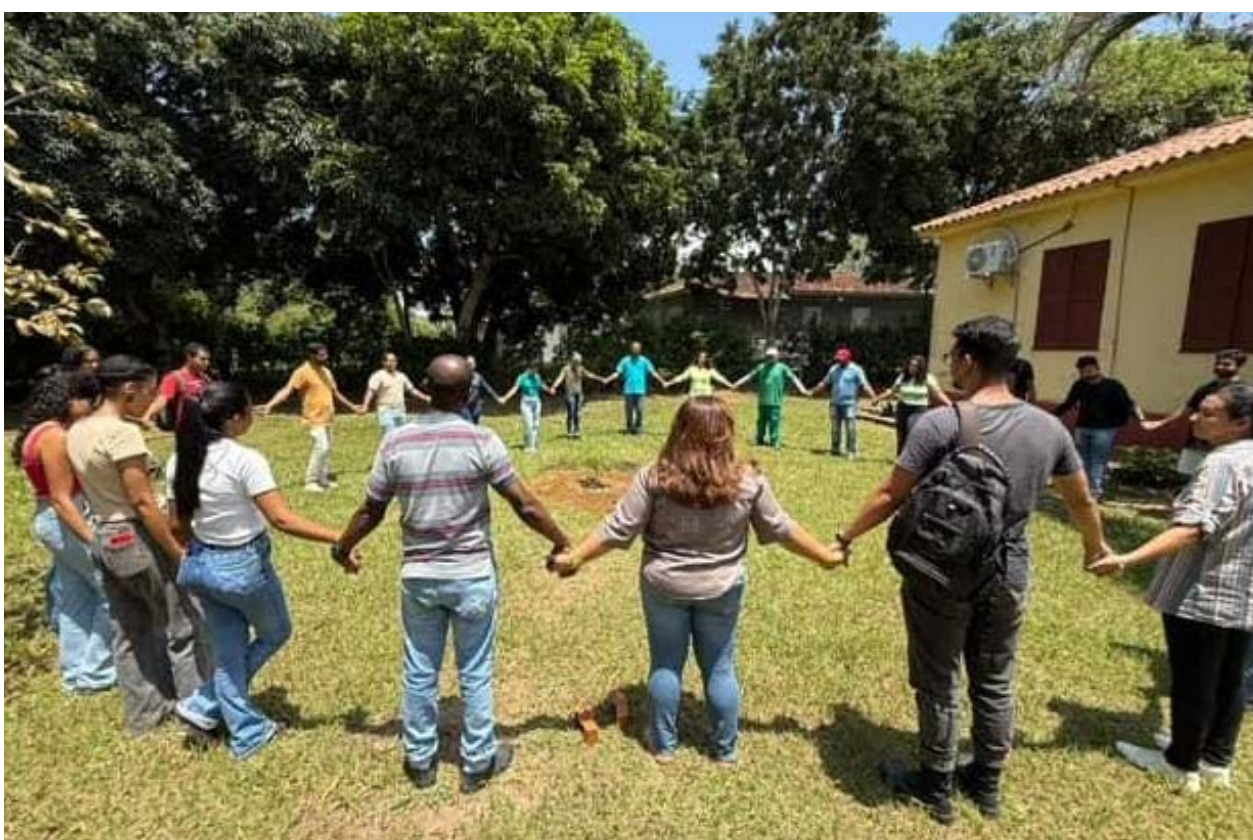
FIGURA 3 – VISITA DOS ALUNOS DO CURSO DE AGRONOMIA, DISCIPLINA PAISAGISMO – UFRB

O público interno é composto principalmente por pessoas que trabalham ou estudam na UFRB (Figura 3). São estudantes, servidores, funcionários, voluntários e pesquisadores. É importante valorizar e apoiar o público interno, pois ele contribui com a promoção de ações para atrair o público externo e a preservação e divulgação do patrimônio, além de entender e se apropriar do processo da instituição a qual é vinculado.