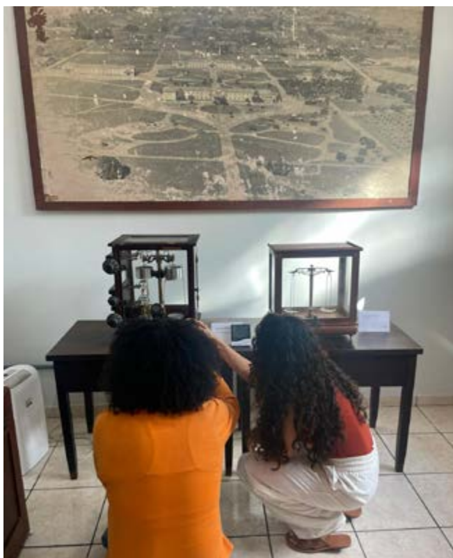
FIGURA 2—PESQUISADORAS EM ATIVIDADE NO ACERVO DO MEASB/ FONTE: ACERVO DO MEASB

Os pesquisadores (figura 2) procuram o MEASB para investigação aprofundada em temas específicos para expandir seus conhecimentos acerca do acervo do Memorial e disponibilizar ao público interessado o resultado de sua pesquisa.