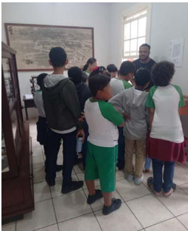
FIGURA 1—ESTUDANTES DA EDUCAÇÃO BÁSICA

Os pesquisadores (figura 2) procuram o MEASB para investigação aprofundada em temas específicos para expandir seus conhecimentos acerca do acervo do Memorial e disponibilizar ao público interessado o resultado de sua pesquisa.