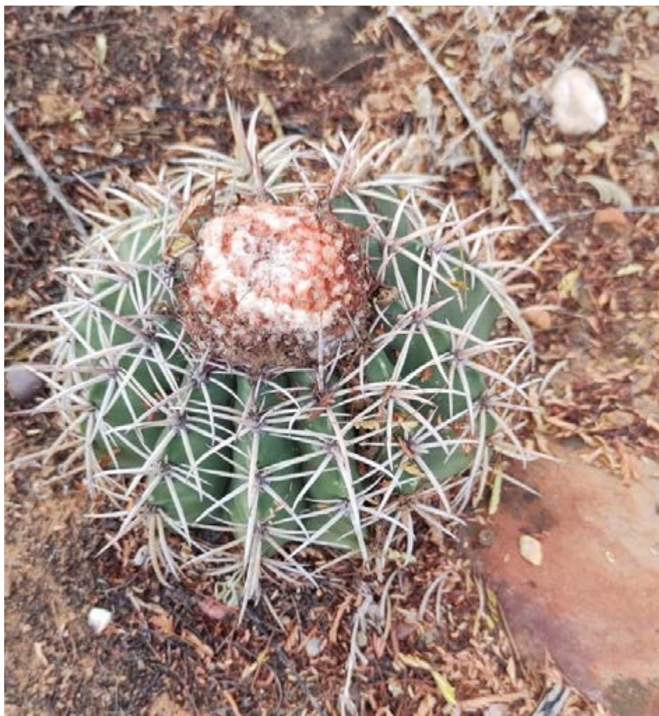
FIGURA 5- CACTO COROA-DE-FRAIDE/ ARACI/BA, 2024.