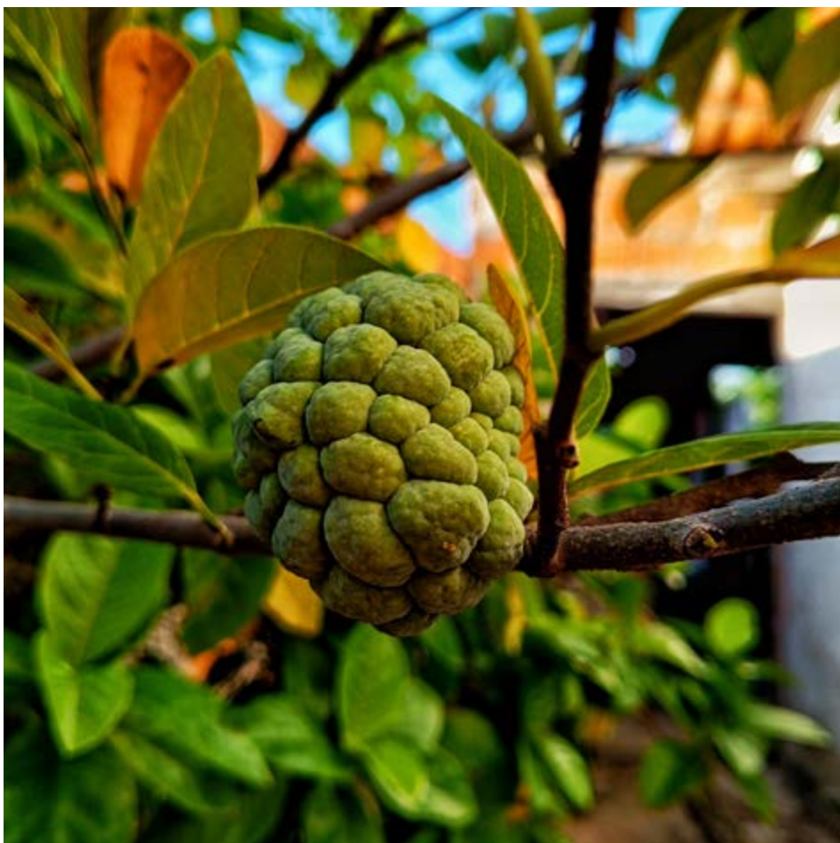
FIGURA 1- PINHA À LUZ DO DIA