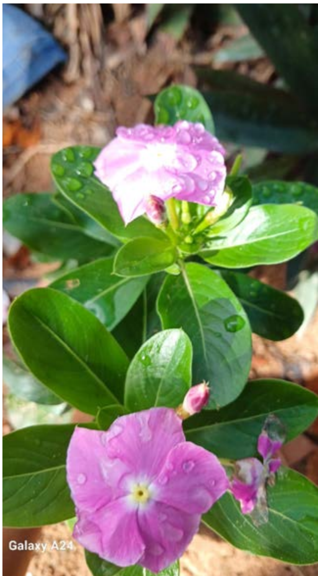
FIGURA 3- FLORES DELICADAS/ FONTE: ARQUIVO PESSOAL, TEOFILÂNDIA/BA, 2024.

Havia registros de flores delicadas (Figura 3), troncos retorcidos como se contassem histórias (Figura 4), árvores frutíferas, frutos como a pinha, a siriguela e o mamão, hortaliças como o coentro e o hortelã grosso além de muitos cactos.