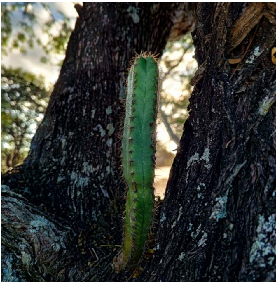
FIGURA 2- CACTO SOBRE TRONCO/ FONTE: ARQUIVO PESSOAL, TEOFILÂNDIA/BA, 2024.