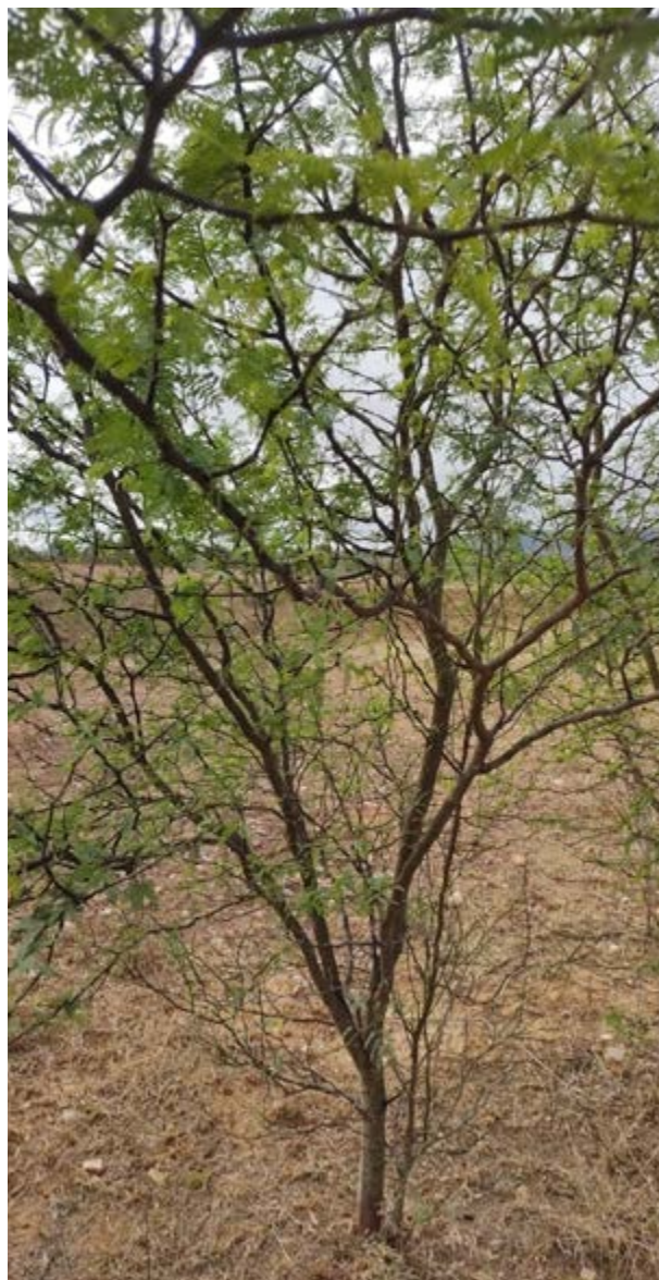
FIGURA 4- TRONCOS RETORCIDOS/ FONTE: ARQUIVO PESSOAL, TEOFILÂNDIA/BA, 2024.

Em meio às conversas despertadas pelas fotografias, um momento em especial trouxe à tona a força do território e das memórias que nele germinam. Uma estudante, ao apresentar sua imagem do cacto coroa-de-frade (Figura 5), compartilhou com simplicidade e firmeza: “- Professora, lá na roça da minha família, quando faltava comida para o gado, a gente queimava esse cacto e depois dava pra ele comer.”