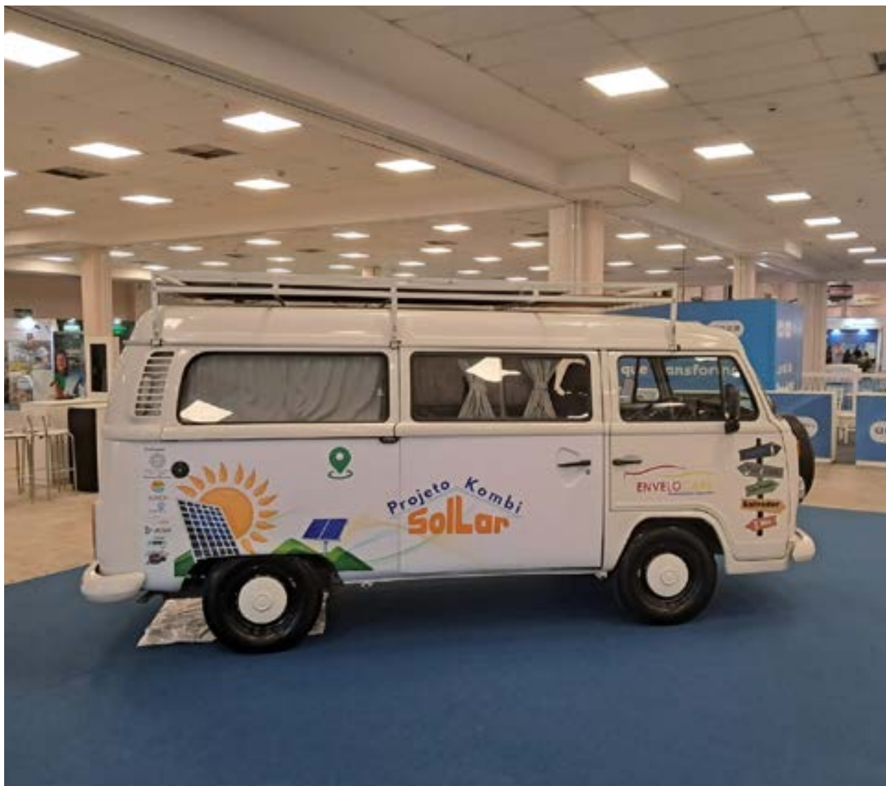
FIGURA 1- PROJETO KOMBI SOLLAR NO BOGE 2025.