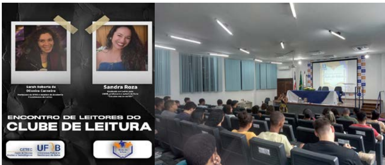
FIGURA 3 – ARTEFATOS VISUAIS DE DIVULGAÇÃO DO CLUBE DE LEITURA CETEC /FONTE: EACERVO DO PROJETO (2023).