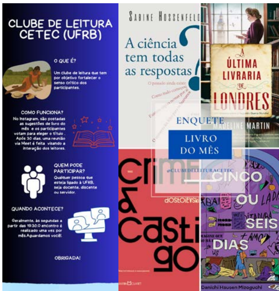
FIGURA 1 – ARTEFATOS VISUAIS DE DIVULGAÇÃO DO CLUBE DE LEITURA CETEC