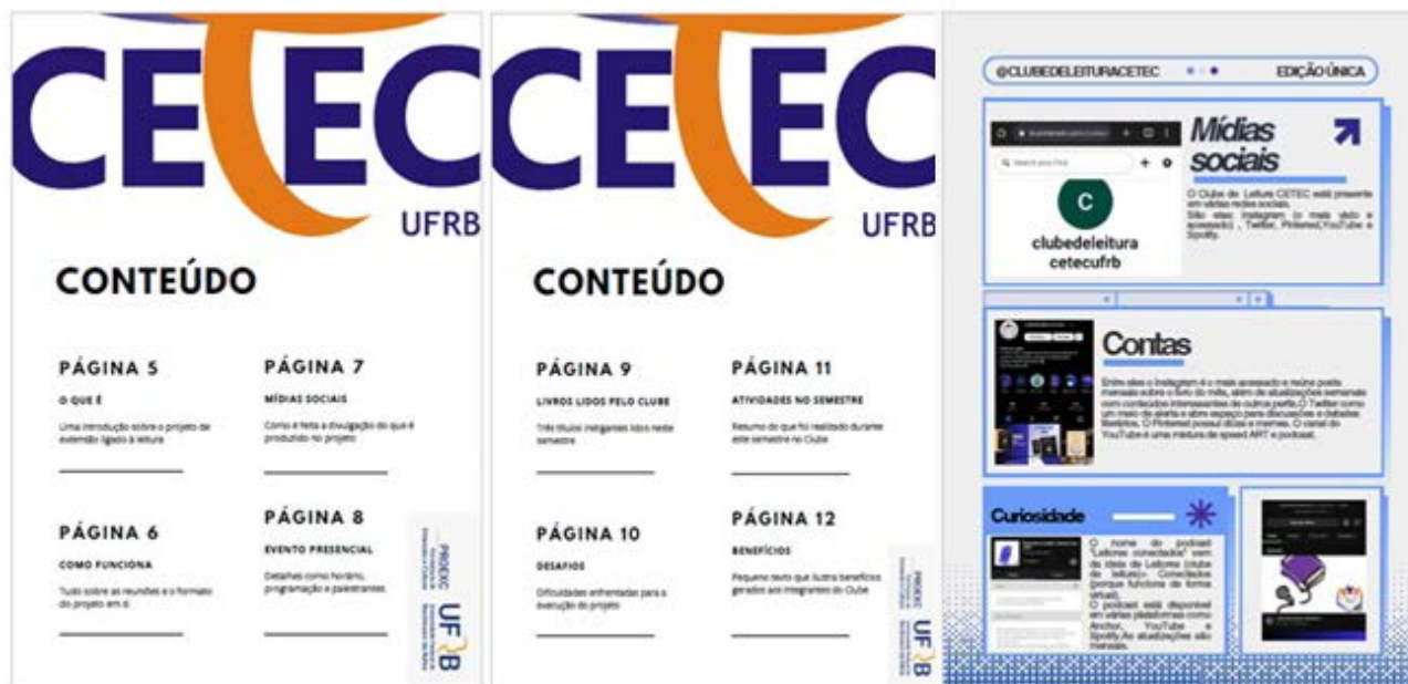
FIGURA 4 – RECORTES DO CONTEÚDO DA REVISTA DO CLUBE DE LEITURA CETEC/UFRB

A elaboração da Revista do Clube de Leitura CETEC/UFRB, em edição única, foi um marco importante para o encerramento do projeto e oportunizou a consolidação dos aprendizados dos resultados alcançados. Na Figura 4 são mostrados alguns itens do sumário da publicação. O conteúdo completo pode ser acessado no link: https://drive.google.com/file/d/1BJkb1GUYod2n0iMiFRJ9qou59uGzx9g3/view?pli=1 .