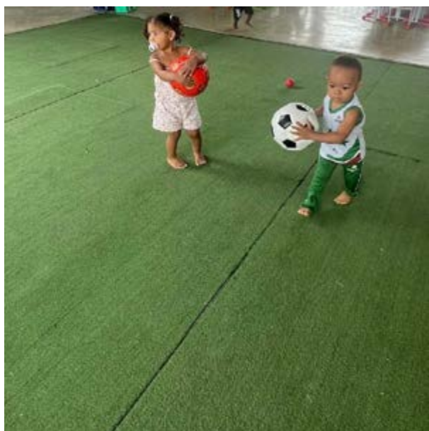
FIGURA 1 – HABILIDADES MOTORAS DE CHUTAR E ARREMESSAR