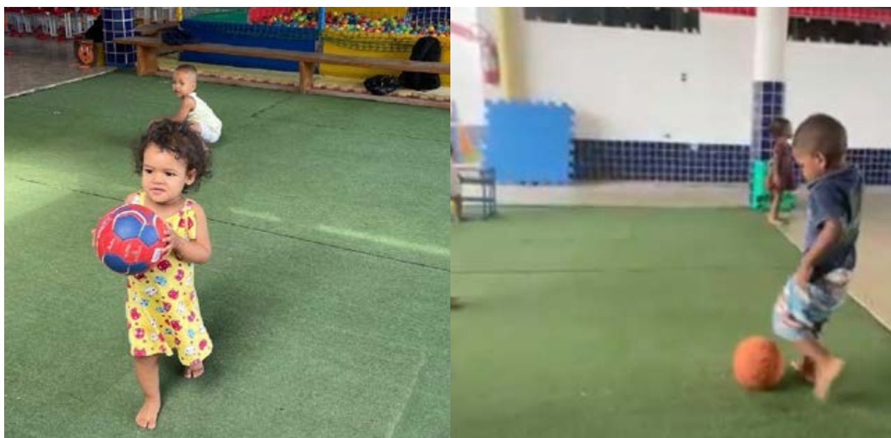
FIGURA 4 – HABILIDADES MOTORAS DE CHUTAR E REBATER COM OS PÉS E INTERSECÇÕES DE GÊNERO / FONTE: AUTORIA DA EQUIPE DE TRABALHO (2024).

A avaliação na Educação Física permite a constatação, interpretação, compreensão e explicação da realidade acerca da cultura corporal (Coletivo de Autores, 1992). A figura 2, retrata uma aula cujo objetivo estabelecido às crianças foi golpear a bola com os pés em direção a um alvo. Notamos que os meninos realizaram o chute ou o golpe de imediato, sem que fosse, verbalmente, solicitado pelas professoras. Percebemos que a bola constituiu, um objeto com essa finalidade para os meninos. Por outro lado, notamos que entre as meninas a ação motora foi diferente, as tentativas foram em pegar, segurar e lançar a bola com as mãos.