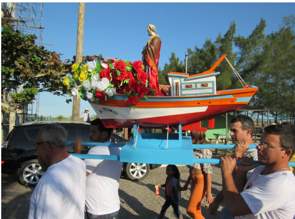
Figura 4: Pescadores marítimos de Barra do Furado carregam a imagem de São Pedro