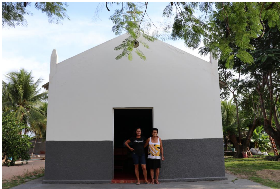
Figura 3: Leia e sua mãe, na igreja construída pelo pai em Beira de Lagoa