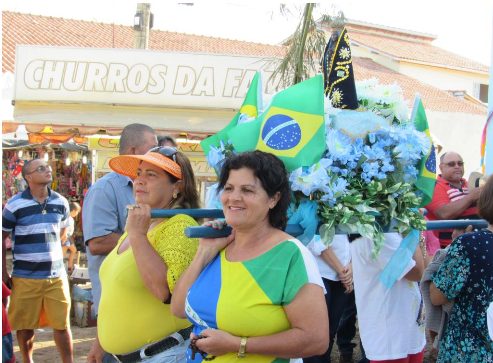
Figura 5: Pescadoras carregam a imagem de Nossa Senhora Aparecida para a procissão fluvial