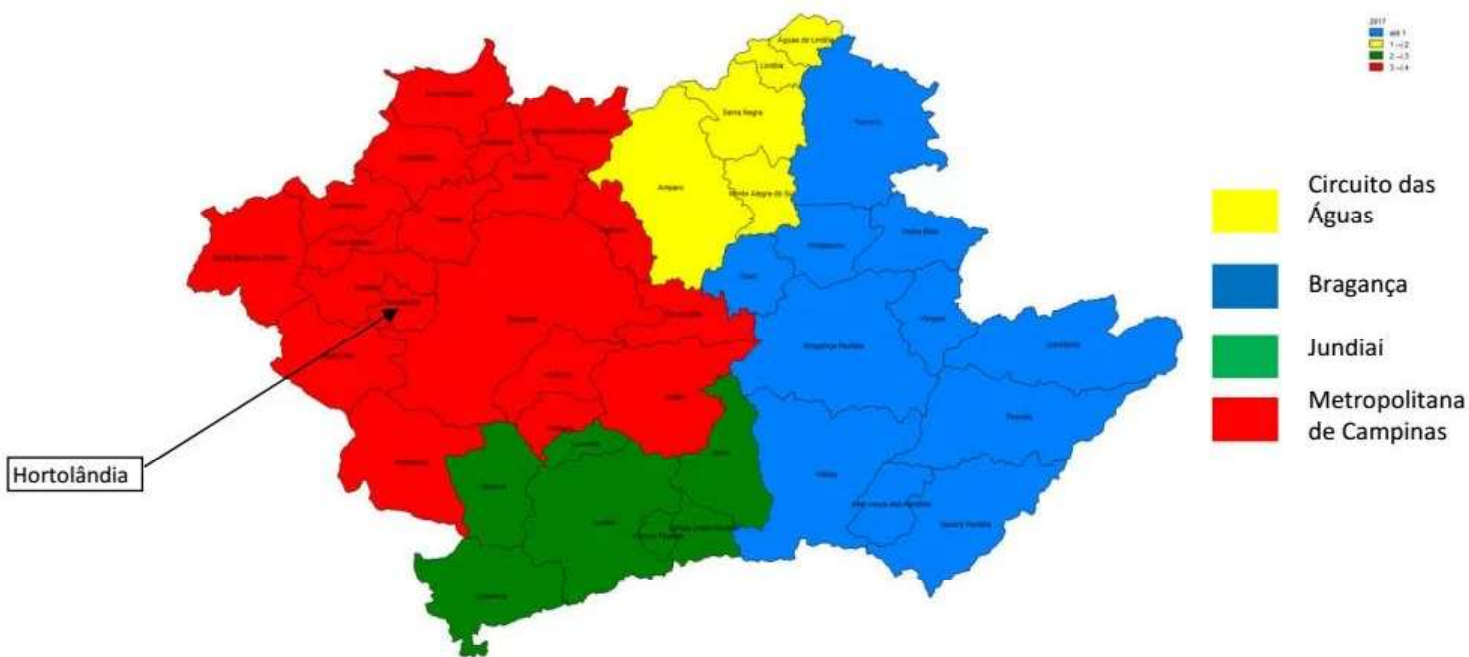
Figura 1. Mapa segundo Regiões de Saúde. DRS VII, 2017

A Secretaria Municipal de Saúde de Hortolândia é composta por quatro Departamentos: Assistência à Saúde, Planejamento e Regulação, Administração e Vigilância em Saúde.