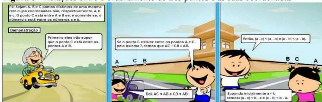
Figura 8 - Relações entre o ordenamento de três pontos e as suas coordenadas

Na opinião dos estudantes, a demonstração presente na figura 8 seria mais inteligível se, no início do texto, fossem utilizados números em vez de letras para representar as coordenadas dos pontos A, B e C. Somente após a apresentação de vários exemplos numéricos, dever-se-ia passar para as representações algébricas, sugeriram os participantes.