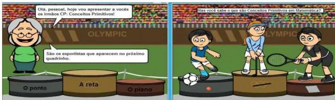
Figura 2 - Tirinha da HQ Dona Geometria em: os esportistas matemáticos

A HQ 3 , intitulada Dona Geometria em: a corrida pelo saber , apresenta o