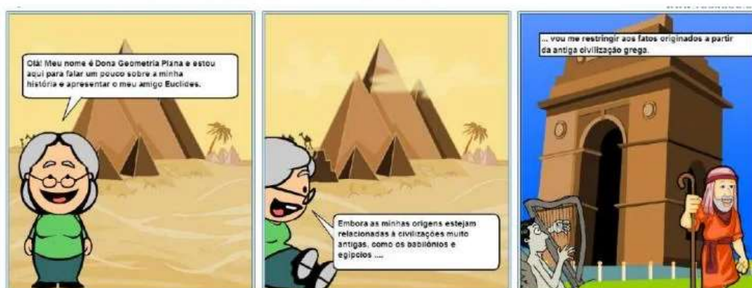
Figura 1 - Dona Geometria se apresentando ao leitor

Na HQ 2 , intitulada Dona Geometria em: os esportistas matemáticos , tenta-se estabelecer relações entre algumas práticas esportivas (futebol, vôlei, basquete) e os conteúdos geométricos. Na história, os “esportistas matemáticos” são três irmãos apaixonados por esportes e pela Matemática. Eles são nomeados pela protagonista, Dona Geometria, como o Ponto , a Reta e o Plano , conforme mostra a figura 2.