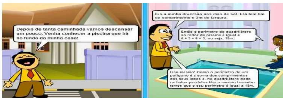
Figura 4 - Cálculo do perímetro de um quadrilátero

Na tirinha retratada na figura 4, o conceito de perímetro de um polígono é apresentado. Para tal, são utilizadas as medidas do bordo de um piscina localizada na casa de um dos personagens. As histórias completas não apresentadas neste texto por