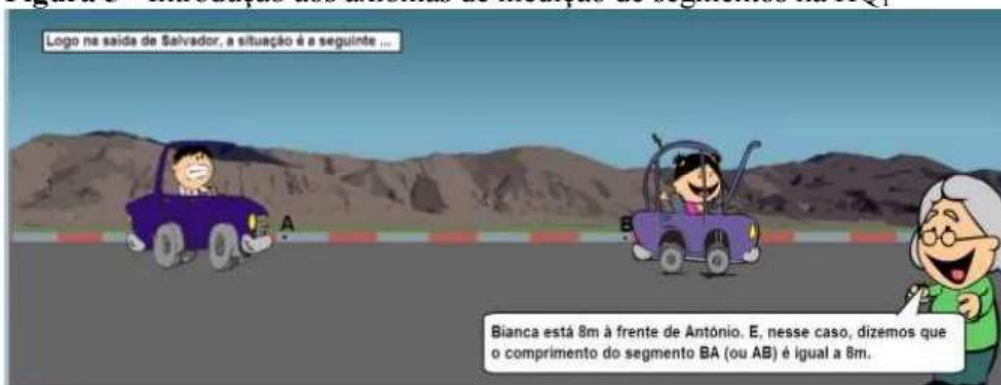
Figura 5 - Introdução aos axiomas de medição de segmentos na HQ 1

De acordo com um dos alunos, a história a que se refere a figura 5 “ficou boa, porque ela já vem diretamente de Salvador para cá [a cidade de Amargosa], a gente já vai entender o trajeto, explicando em parte sim, essa revista tá boa” [A 9 , E]. Outro estudante reforça o interesse por narrativas que fazem conexões entre a geometria e o seu dia a dia ao assinalar que “a HQ explica o assunto através de coisas do nosso cotidiano e essa relação fica mais fácil de entender” [A 25 , Q 2 ].