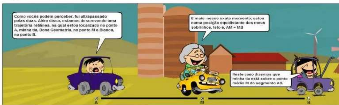
Figura 3 - Apresentação do ponto médio de um segmento

Na HQ 4 , intitulada Dona Geometria em: subindo mais um degrau , ocorre o estudo dos axiomas de medição de ângulos e das suas consequências. Na história, Dona Geometria tem a companhia de dois amigos, Ana Bissetriz (uma executiva que sonhava em ser bailarina) e Ângelo Agudo (um arquiteto que gostaria de dar aulas de Desenho Geométrico). Nas últimas tirinhas da HQ apresentam-se os conceitos de bissetriz, diagonal e perímetro de um polígono e a classificação dos polígonos quanto ao número de lados. A figura 4 apresenta uma tirinha da HQ.