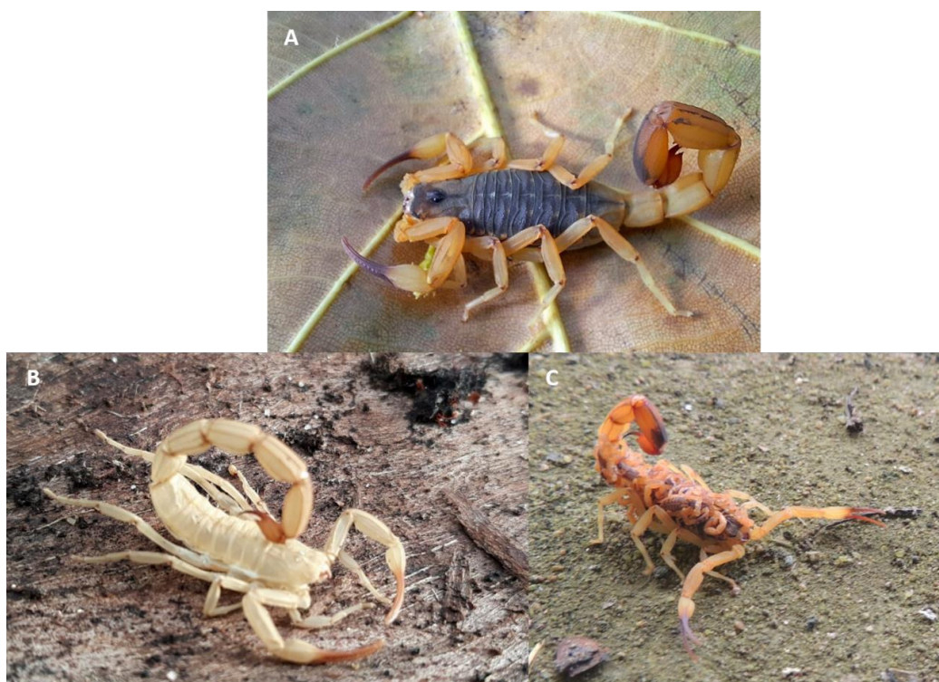
Figura 2. Espécime de Tityus serrulatus (A), ecdise (B) e fêmea carregando seus filhotes no dorso.

genitora (Figura 2), (Brasil; Porto, 2010). Em outras espécies, como Tityus serrulatus Lutz & Mello, 1922 e o Tityus stigmurus Thorell, 1876, a reprodução ocorre por partenogênese, ou seja, os ovócitos das fêmeas se desenvolvem diretamente em embriões, não havendo a necessidade de um macho encontrar uma fêmea para reproduzir, o que amplia sua capacidade de dispersão (Gomes et al. , 2022).